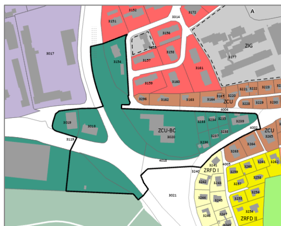
Figure 2 : Secteur Belle-Croix (PAZ Nouveau)

L'élaboration du futur PAD pour le secteur définira le projet d'urbanisation à concrétiser dans le secteur. En fonction du type de projet, il se peut que certains équipements de base soient à adapter.